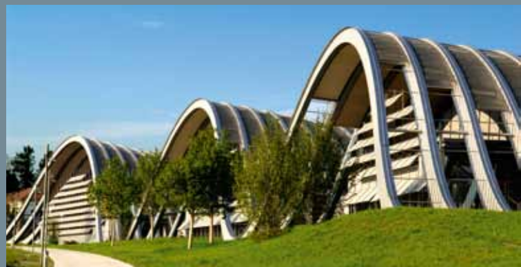
Kulturzentrum Paul Klee, Bern; Maurice E. a. Martha Müller Foundation