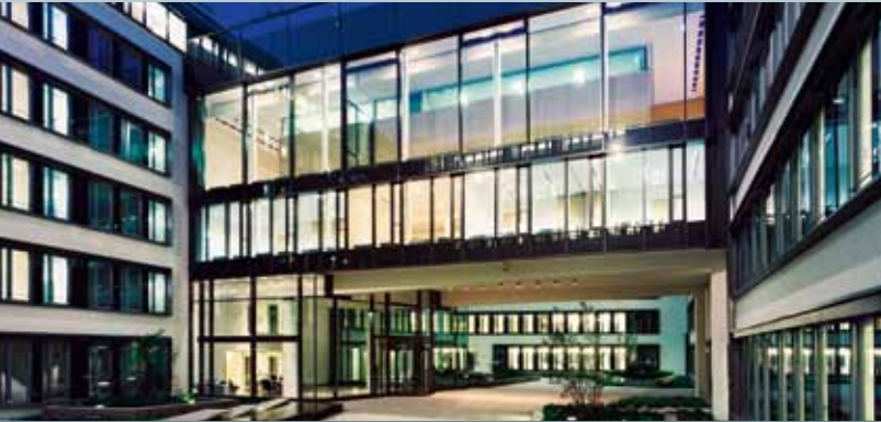
Bürogebäude Lehel Carré München; Versicherungskammer Bayern