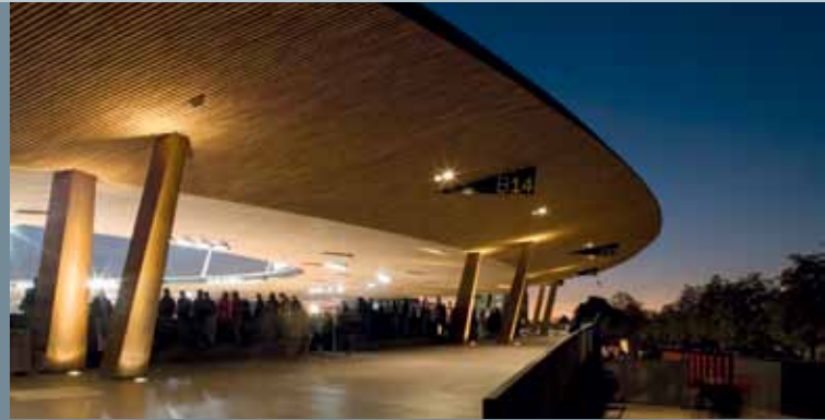
Stadion Letzigrund, Zürich; Sportamt Stadt Zürich