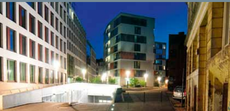
Bürogebäude Brahm's Quartier, Hamburg; Aug.Prien Immobilien