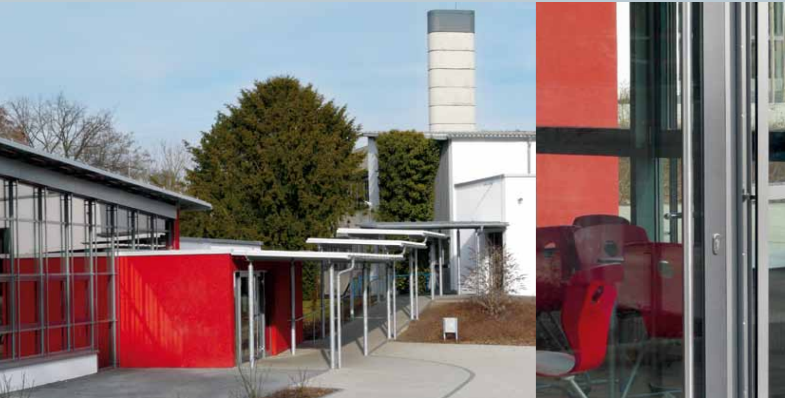
Integrierte Gesamtschule Solms im Lahn-Dill-Kreis