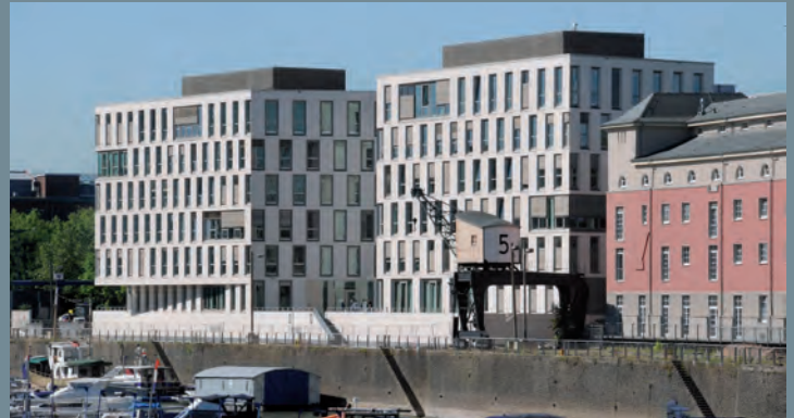
ifb Pier 5, Köln | Ausschreibung Facility Services