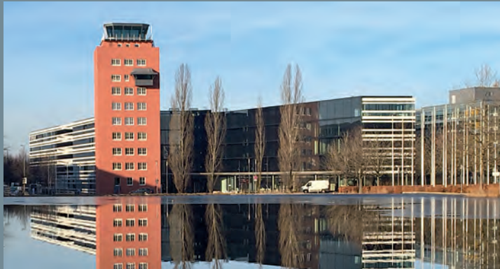
Tower Riem, München | Ausschreibung Facility Services © CL MAP GmbH