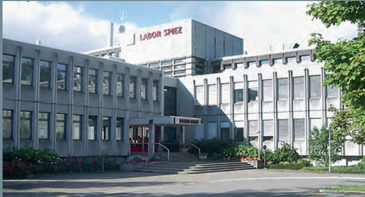
Labor Spiez, Spiez | Support und QS Service-Level-Agreement EV-BE © Fachverein Bio-Alumni, Zürich