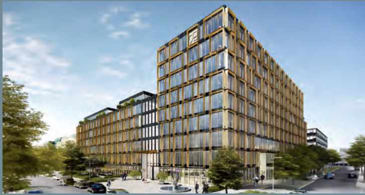
NOVE, München | Ausschreibung Facility Services © Antonio Citterio Patricia Viel and Partners