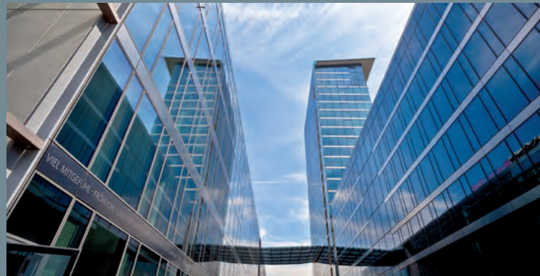
Büroensemble THE m.pire, München | Ausschreibung Technische Dienstleistungen