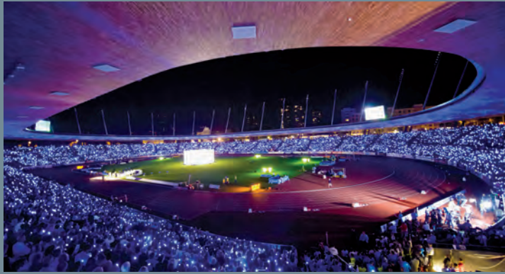
Stadion Letzigrund, Zürich | Ausschreibung Catering, Reinigung und technische Dienstleistungen