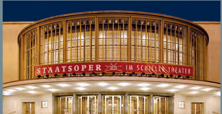
Schiller Theater Berlin | Ausschreibung Facility Services