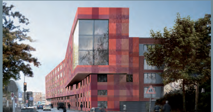
Entertainmenthaus St. Pauli, Hamburg | Ausschreibung Facility Services