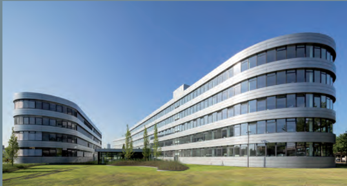
Hauptverwaltung RheinEnergie, Köln | Ausschreibung Catering und Sicherheitsleistungen