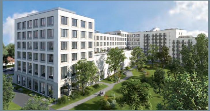
Büroensemble Südwind, München | Ausschreibung technische und infrastrukturelle Services © KSP Jürgen Engel Architekten