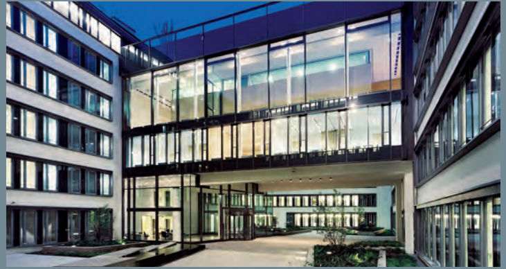
Büroensemble Lehel Carrée, München | Ausschreibung Facility Services