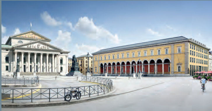
Palais an der Oper, München | Ausschreibung Property und Facility Services © Accumulata Immobilien Development, LBBW Immobilien