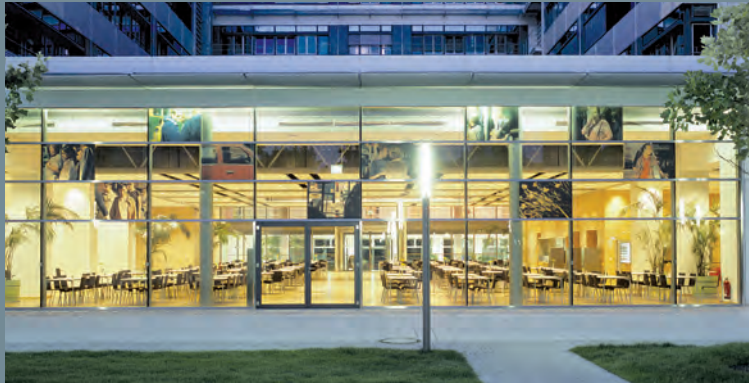
Hauptzentrale Versicherungskammer Bayern, München-Giesing | Ausschreibung Technische Dienstleistungen