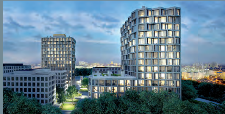
Wohntürme FRIENDS, München | Ausschreibung Property und Facility Services