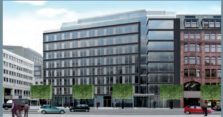
API Opfern Plaza, Hamburg | Ausschreibung Facility Services © Florian Fischötter Architekt GmbH, Hamburg