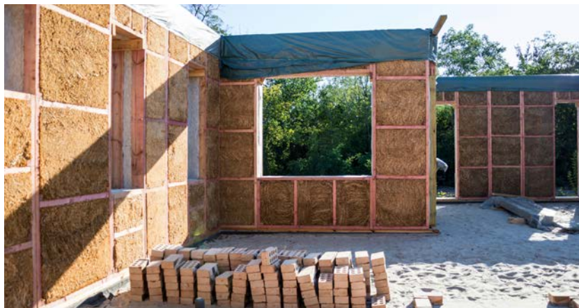
Construction d'une maison en matériaux végétaux écologiques: le cadre est en bois et rempli de blocs de paille.