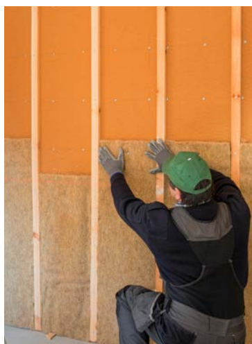
Isolation thermique avec des panneaux de fibres de bois et du chanvre naturel.

ces matériaux de construction, six ont participé au projet de recherche. Ils ont été aidés dans la détermination de l'écobilan de leurs produits et/ou dans leur processus d'inscription sur la liste KBOB.